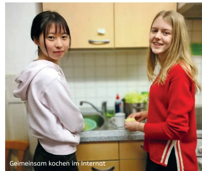
Geheimlich kochen im Internat